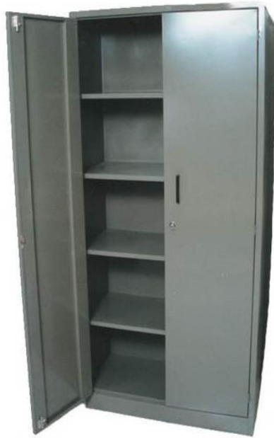
G. UNIVERSAL ENTREPAÑOS FIJOS Medidas 87 * 37 * 120 cm. 87 * 37 * 160 cm. 87 * 37 * 180 cm