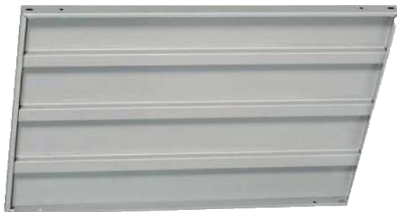
CHAROLA 60 X 85 (3 refuerzos) cal. 22,24,26