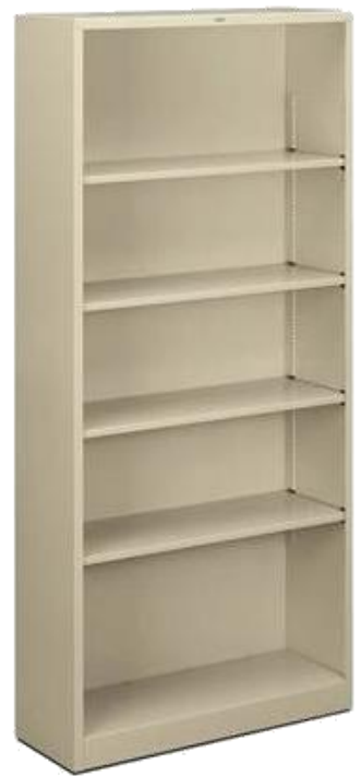
LIBRERO SIN PUERTAS CAL. 22 Medidas 180 * 85 * 39