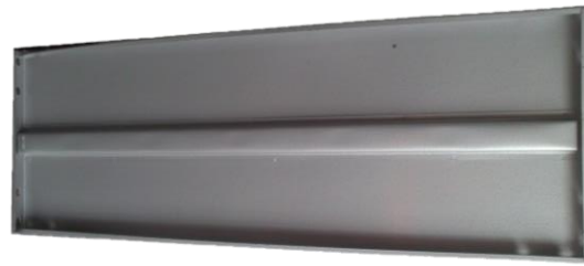
CHAROLA 30 X 85 (1 refuerzo) cal. 22,24,26,28