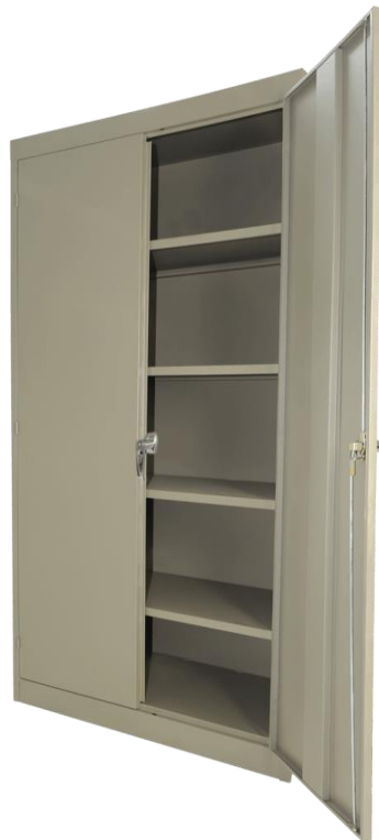
G. UNIVERSAL 4 ENTREPAÑOS MÓVILES CAL. 22 Medidas 180 * 85 * 45 cm