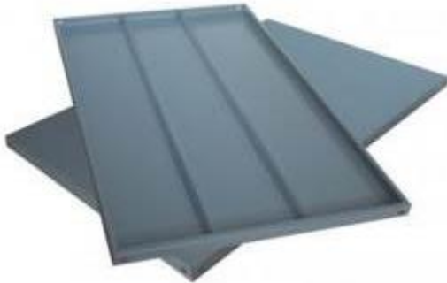
CHAROLA 45 X 85 (2 refuerzos) cal. 22,24,26