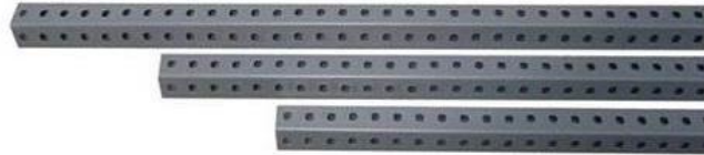
Postes 220 cm calibres: 14, 16, 18 y 20